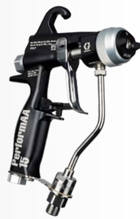
PERFORMAA AIRLESS-PISTOLEN Sind mit 105 bar (1.500 psi) für Anwendungen mit niedriger Viskosität und 345 bar (5.000 psi) für das Spritzen mit hohem Druck erhältlich.

Die leichteste luftunterstützte Pistole auf dem Markt (460 Gramm) maximiert die Produktivität des Bedieners.