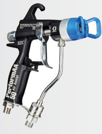
DIE LUFTUNTERSTÜTZTE PISTOLE PERFORMAA 50 Spritzt mit 345 bar (5.000 psi) für Top-Leistung bei hohem Druck.