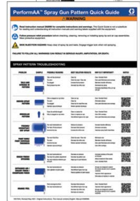
Anleitung für Spritzbilder