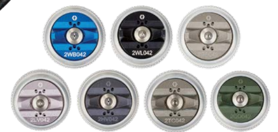
Pistolenmodelle mit materialspezifischen Luftkappen

Die Airless-Luftkappe von PerformAA funktioniert mit der AXM- oder AXF-Düse und liefert ein gleichmäßiges Spritzbild.