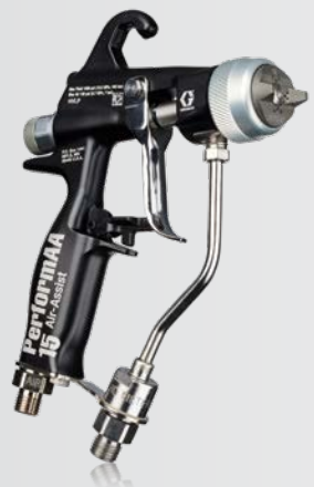
DIE LUFTUNTERSTÜTZTE PISTOLE PERFORMAA 15 Spritzt mit 105 bar (1.500 psi) für optimale Leistung bei niedrigem und mittlerem Druck.